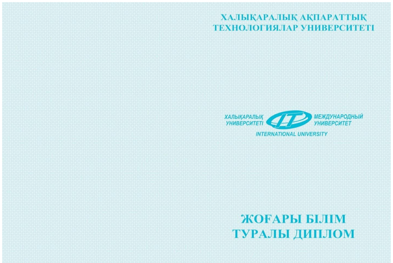
Приложение 1. Диплом о присуждении степени «бакалавр» собственного образца (с твердой обложкой)