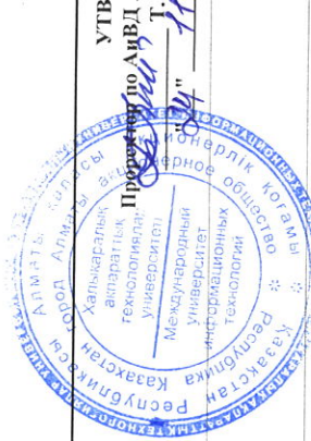
График проведения и темы докладов Зимней школы педагогического мастерства АО МУИТ 2020-2021 уч.год